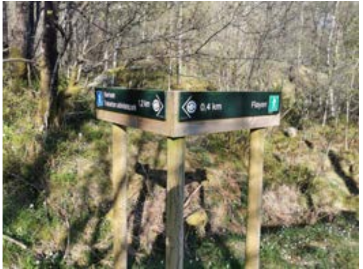
Kløyheim bygdelag har gjort ein stor jobb med å merka og skilta turstiane i bygda etter nasjonal standard.

Både Radøy, Lindås og Meland kommunar hadde ei satsing på friluftsliv i dei siste åra før kommunesamanslåinga. Alle dei tre kommunane gjennomførte mellom anna ei kartlegging og verdisetjing av friluftslivsområde i kommunen. Kommunane var også aktive i turskiltprosjektet, der ein med midlar frå Gjensidigestiftelsen og i samarbeid med lag og organisasjonar merka, skilta og graderte turstiar over heile kommunen etter nasjonal standard. Det er også gjort ei rekkje andre tilretteleggingstiltak på stiar i kommunen. Arbeidet er i all hovudsak utført av frivillige, men kommunen har i ein del tilfelle gjeve tilskot eller kjøpt inn material.