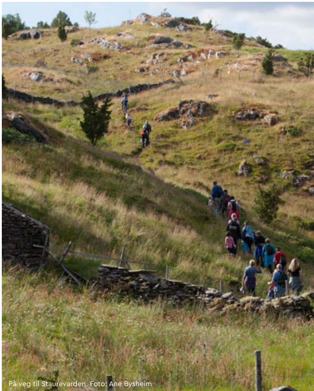
På veg til Staurevarden.