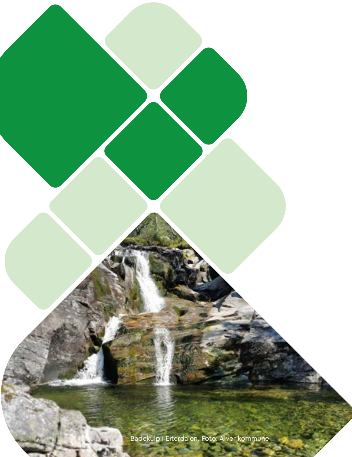
Badekulp i Eiterdalen.