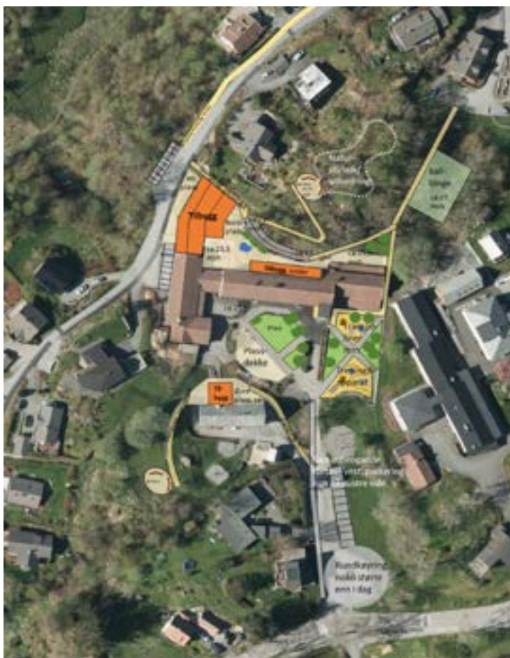
Figur 2: Skisse for utvikling av uteareal. Denne er lagt til grunn ved utrekning av framtidige overvassmengder

Den planlagde utbygginga av Manger skule vil ha lite innverknad på overvassmengdene. Dersom ein legg Figur 2 til grunn, vert det litt fleire tette flater som følgje av tak på tilbygg på skule og parkeringsplass, samtidig som endring av skuleplassen truleg vil medføre høgare infiltrasjon der. Grensene mellom felt 1 og 2 på nordsida av skulen endrar seg truleg dersom vestfløyen vert utvida. Sidan utforminga på dette foreløpig er usikkert, er det ikkje teke høgde for endra feltgrenser. Felt 3-6 endrar seg ikkje som følgje av planlagd utbygging. Det som utgjer størst endring i avrenninga er derfor klimafaktoren.